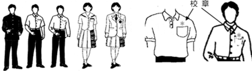
図1 ズボンスタイル

*スカートの丈は、立位で膝頭が隠れる程度の長さとする。 *ワイシャツは長袖または半袖とする。