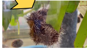
シラヒゲウニ (成体)