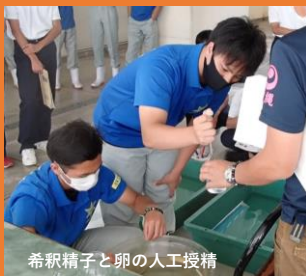
希釈精子と卵の人工授精