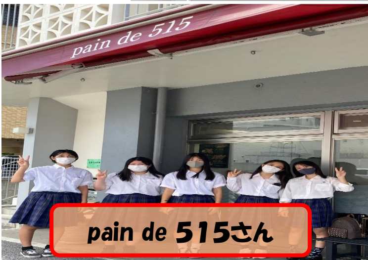
pain de 515さん