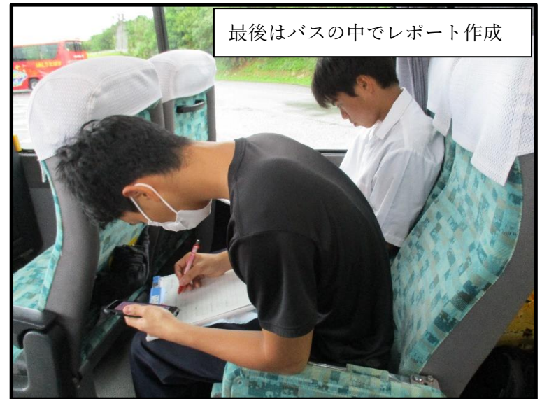
最後はバスの中でレポート作成