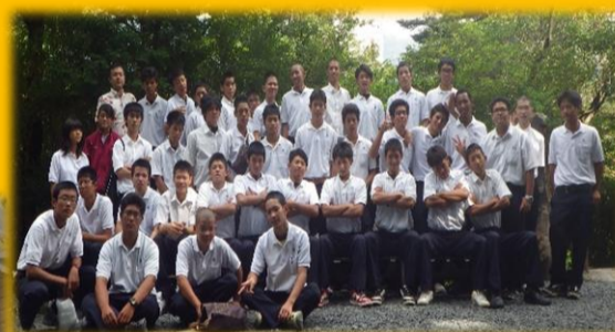
屋久島にて記念撮影！