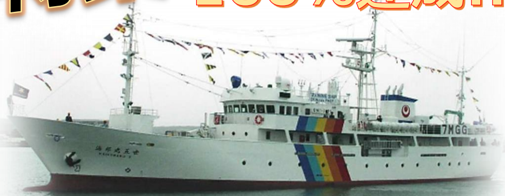
本校実習船「海邦丸五世」(500t) ※令和3年度 新海邦丸就航予定(700t)