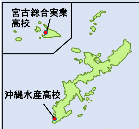
宮古総合実業高校