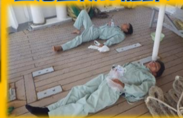
出港直後に船酔い