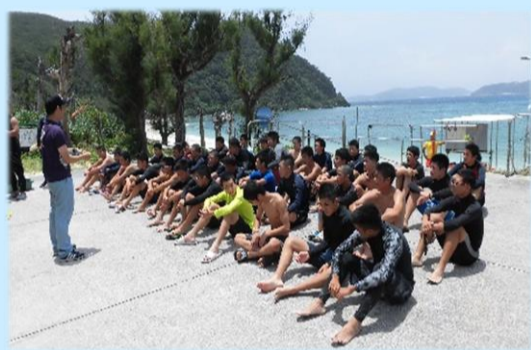
訓練前のミーティング

遠泳実習は2泊3日の日程で周辺の離島で行います！ 船などから海に落ちた際に、救助が来るまで泳ぐ訓練です！