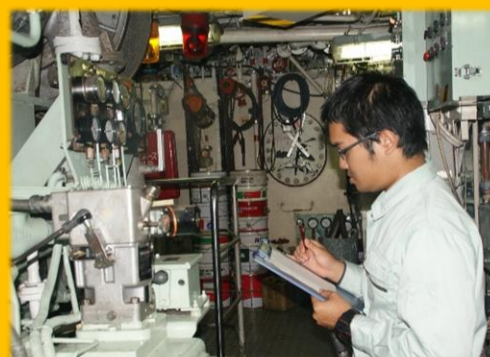
機関の異常を確認

2年生は専門のコースに分かれ20日間の沿岸航海に出ます。国内の大きな港や瀬戸内海などを回り、より専門的な船の運航技術や知識を学びます！