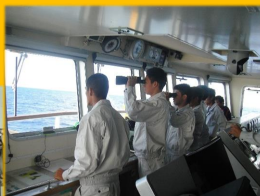
針路に船がないか チェック