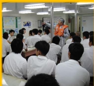
教官による 非常時の説明

1年生は今後の船への適性を考えるため、4～5日の体験航海を行います。船内見学や当直業務を体験します！！