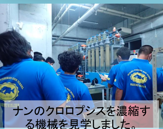
ナンのクロプシスを濃縮する機械を見学しました。