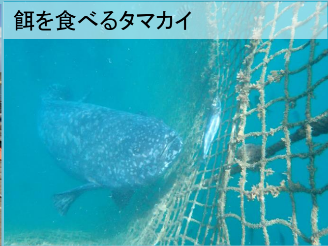
餌を食べるタマカイ