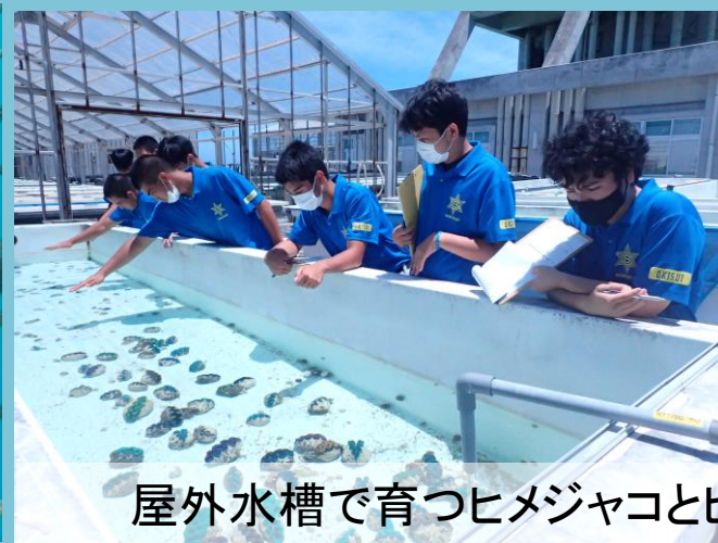
屋外水槽で育つヒメジャコとヒレナシジャコを見学しました。