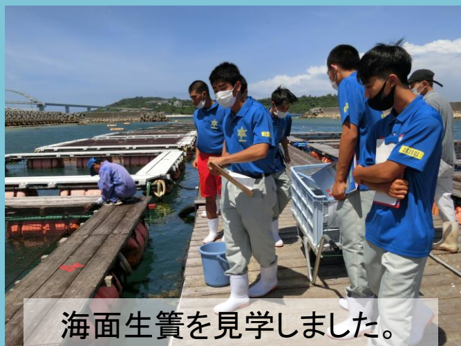
海面生簀を見学しました。

また、スギの受精卵を譲っていただく予定です。種苗生産の実習で育てていきます。 (作成者: 泉川幸 與那覇幸村)