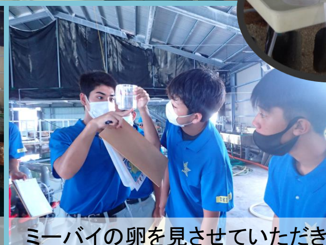
ミーバイの卵を見させていただきました。