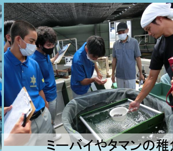
ミーバイやタマンの稚魚を飼育してる屋内水槽